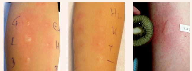
Bild 3 zeigt das Resultat einer Prick-zu-Prick-Testung: dabei wurde das Allergen, z.B. Kiwi, mit der Pricktestnadel angestochen und direkt in die Haut geprickt.