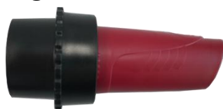
DUSTREAM® Kollektor + schwarze Adapter

Wenn der Kollektor nicht in das Staubsaugerrohr passt, befestigen Sie das schwarze Adapterstück am roten Kollektor, wie es am besten in Ihr Staubsaugerrohr passt. Schalten Sie dann ihren Staubsauger wie gewohnt ein und fange an mit Staubsaugen.